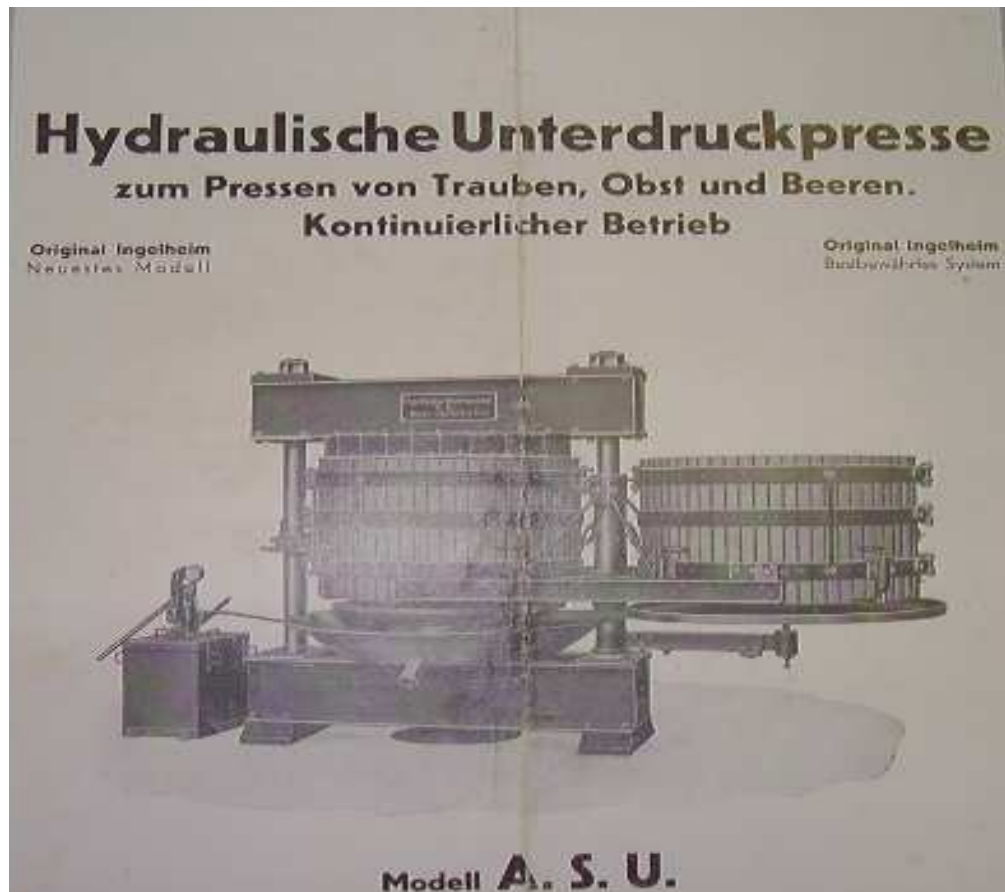
slika1.Preša nabavljena 1940.