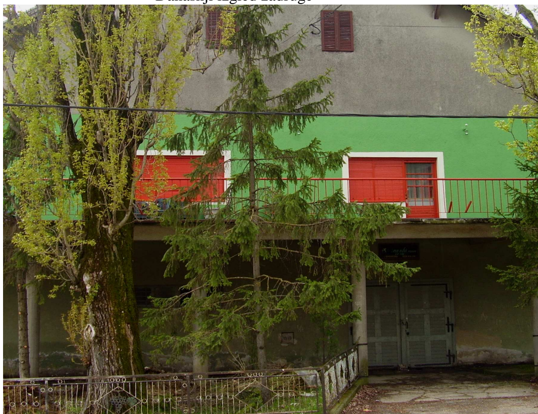
Današnji izgled zadruga